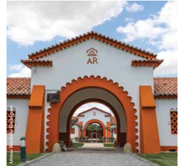
Vila Galé Collection Alter Real Hotel de 4 estrelas dedicado al Arte Ecuestre.