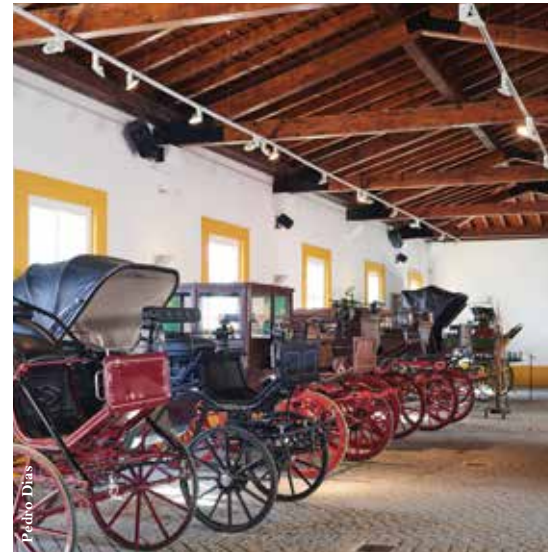
Casa dos Trens Edifício de exposição de coches.