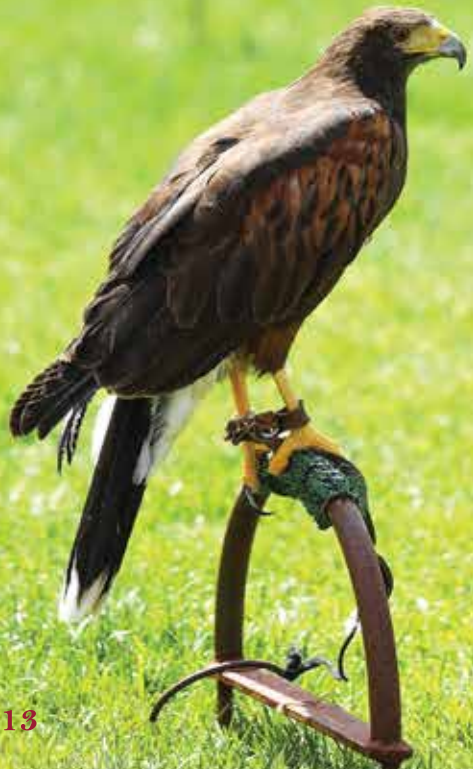
Falcoaria e Museu da Falcoaria Falconry and Falconry Museum Museo de la Cetrería y la Halconería